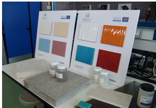
Materiales elaborados a partir de vidrios de TRC reciclados.