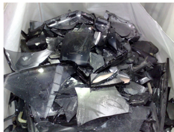
Vidrios televisor (sin salida de mercado)